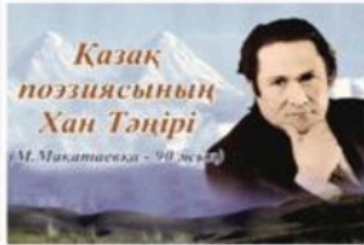
Қазақ поэзиясының Хан Тәңірі М. Мақатаевқа - 90 жасына