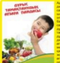
Мәрасының құрамындағы шыршағын тігіледі. Соған